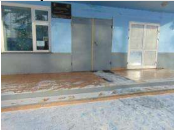
2.3. Знаки доступности, кнопка вызова персонала