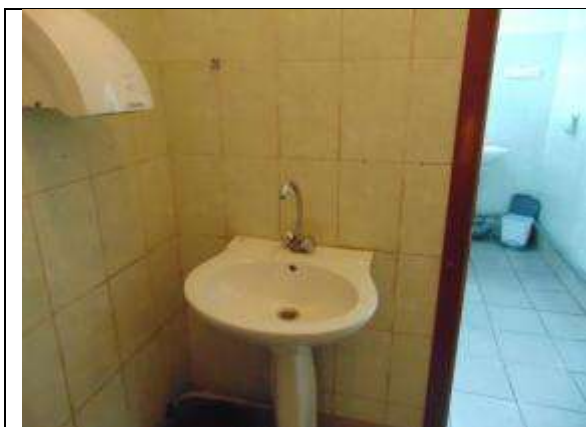
5.2. Туалетная комната