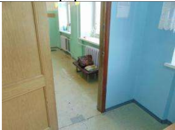
3.6. Вход в столовую