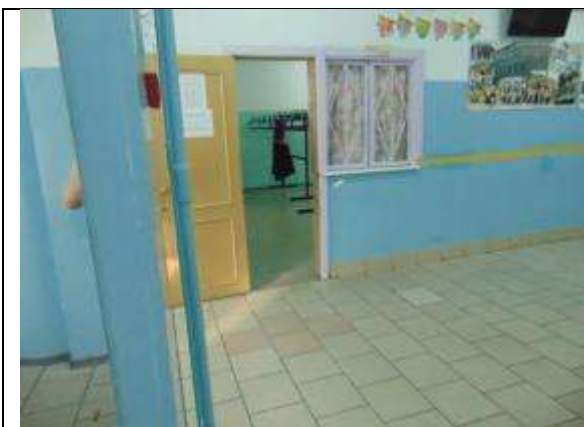
3.4. Лестница внутри здания