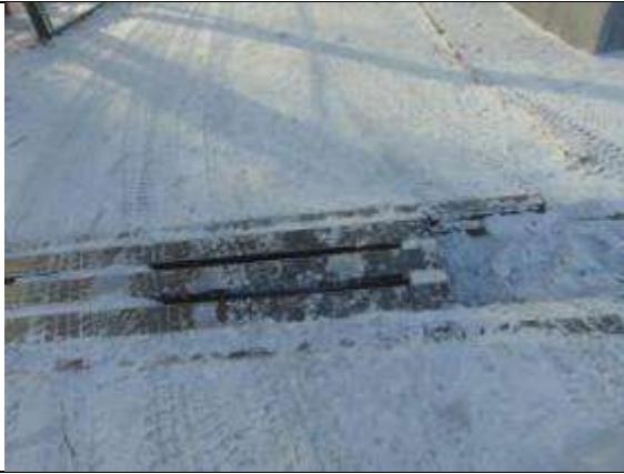
2.1. Наружный пандус