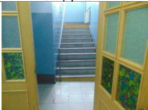
3.5. Вход в гардероб