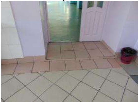
3.6. Вход в спортзал