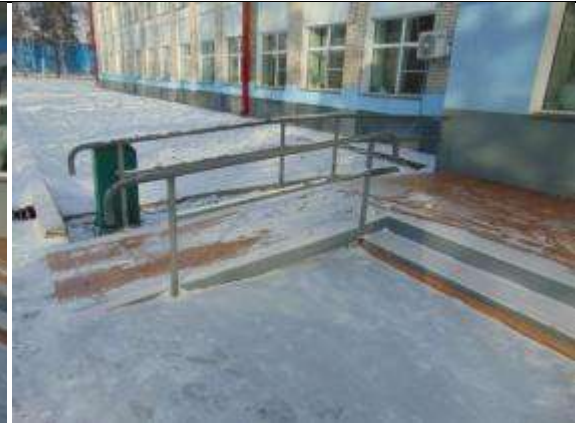
2.2. Центральный вход в здание